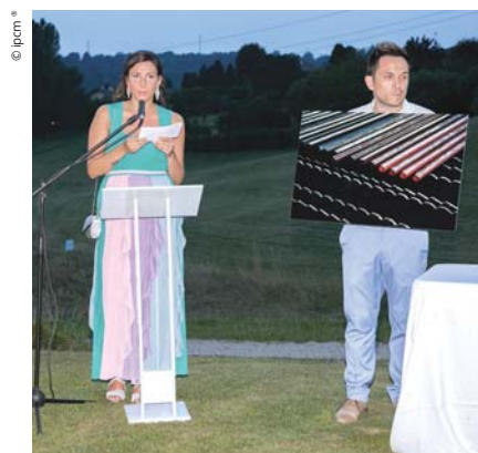
Un momento dell'asta del 24 luglio scorso.

Per maggiori informazioni: www.lucreziaroda.com